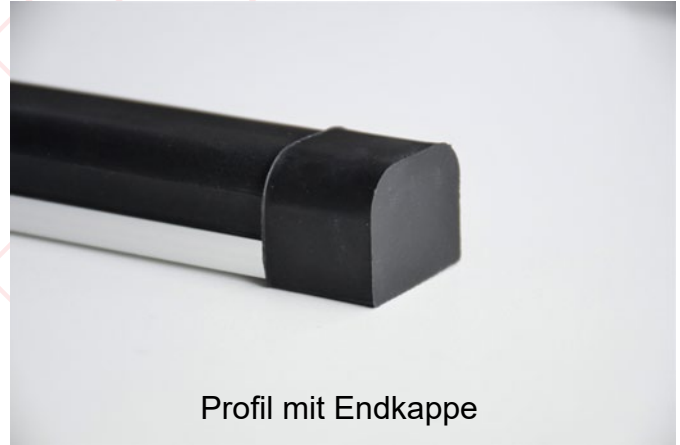
Profil mit Endkappe

Die TS18 ist eine sehr vielseitige Schaltleiste. Sie ist sowohl für Kontrollanwendungen als auch für Sicherheitsapplikationen ideal geeignet. Die dazugehörige flache Montage-schiene aus Aluminium ermöglicht das Einschnappen der Schaltleiste in eine feste Halterung. Das innere Schaltelement wird in die obere Hälfte des Profils eingesetzt, um die sofortige Aktivierung zu gewährleisten.